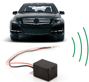
Sender BLINK 868 im Auto